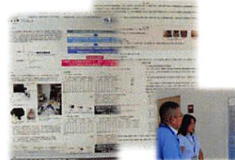
口頭・ポスター発表